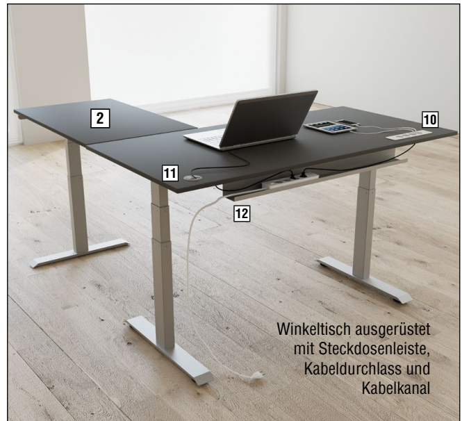
Winkeltisch ausgerüstet mit Steckdosenleiste, Kabeldurchlass und Kabelkanal