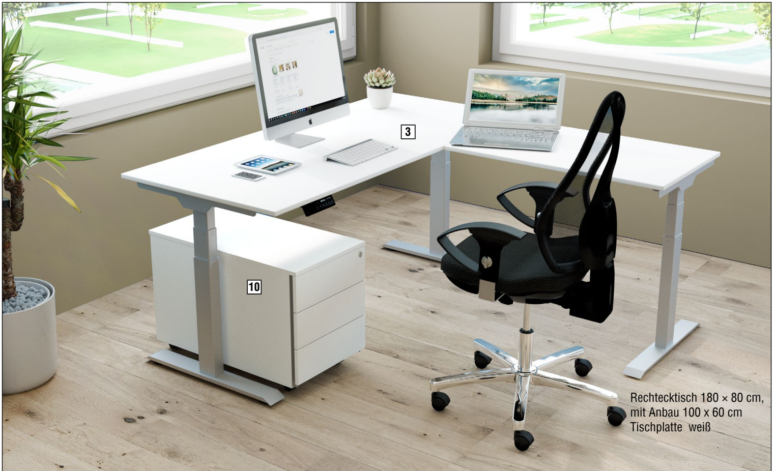
Rechtecktisch 180 × 80 cm, mit Anbau 100 x 60 cm Tischplatte weiß

PROFI-MONTAGE FÜR 24% DES LISTENPREISES mindestens aber € 169,-