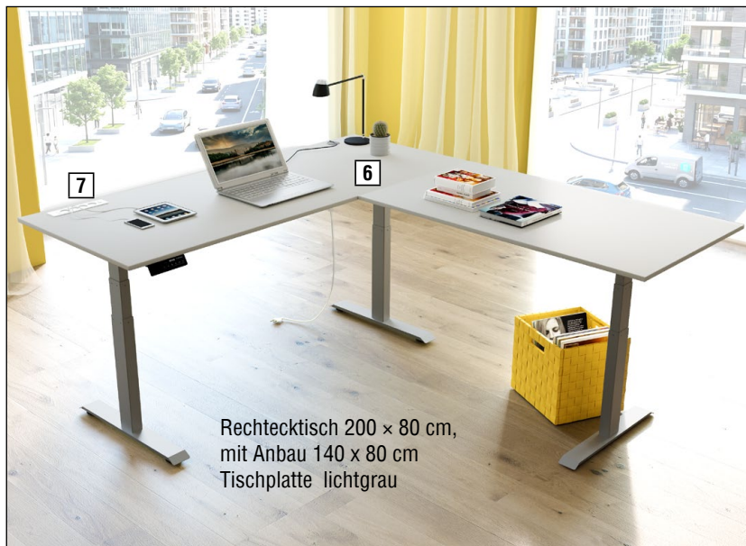
Rechtecktisch 200 × 80 cm, mit Anbau 140 x 80 cm Tischplatte lichtgrau