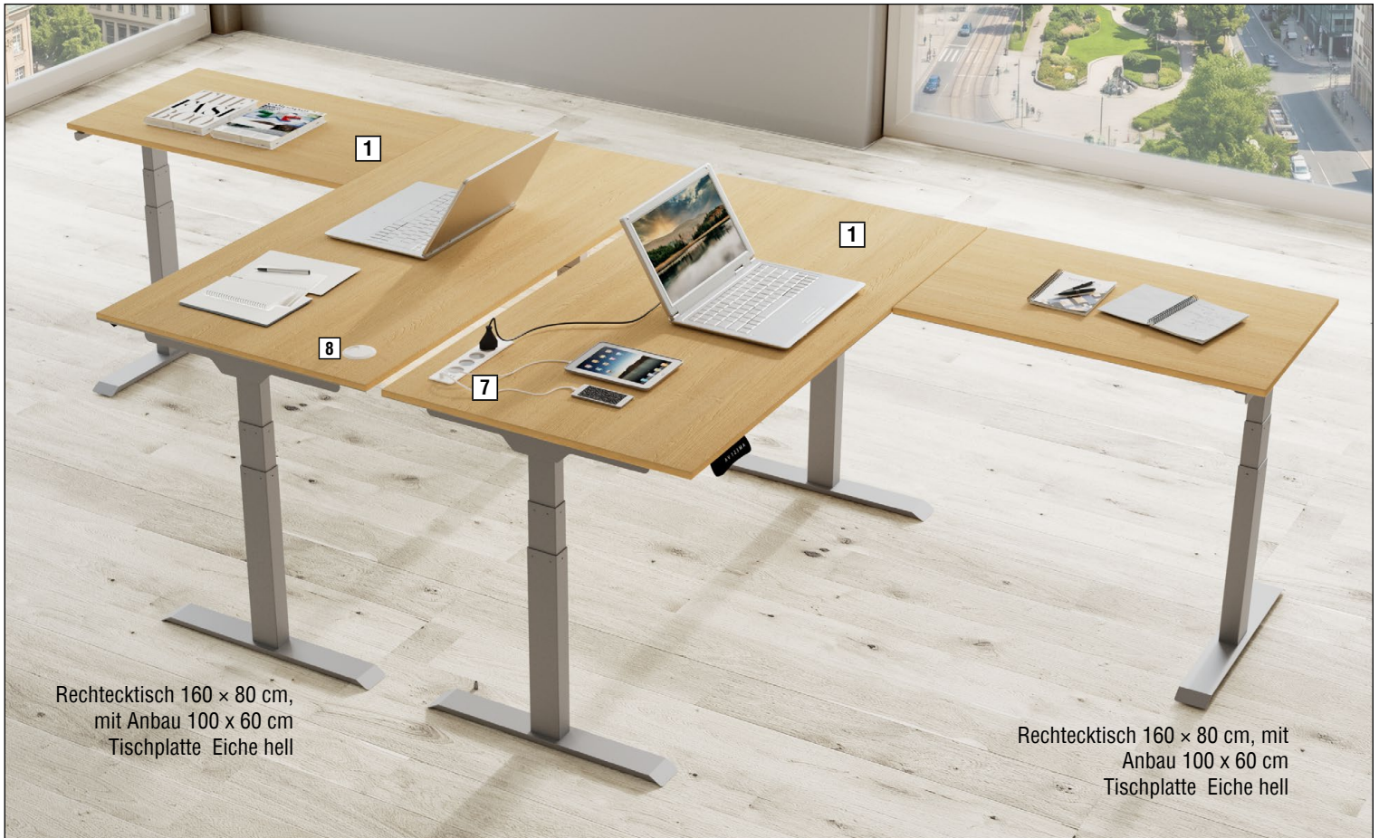
Rechtecktisch 160 x 80 cm, mit Anbau 100 x 60 cm Tischplatte Eiche hell